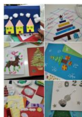
Размена честитки са вршњацима из ОШ „Љуба Нешковић“ Зајечар.